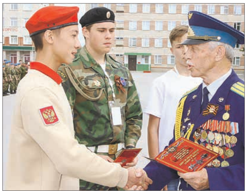
Такой наказ не забудется.

Опыт такой объединенной работы есть у нас в районах и городах области с местными отделениями «Общероссийской общественной организацией ветеранов вооруженных сил РФ».