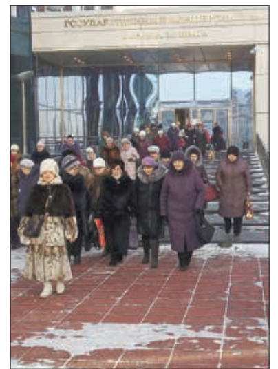
В Новосибирской филармонии очень популярны общедоступные концерты для старшего поколения.