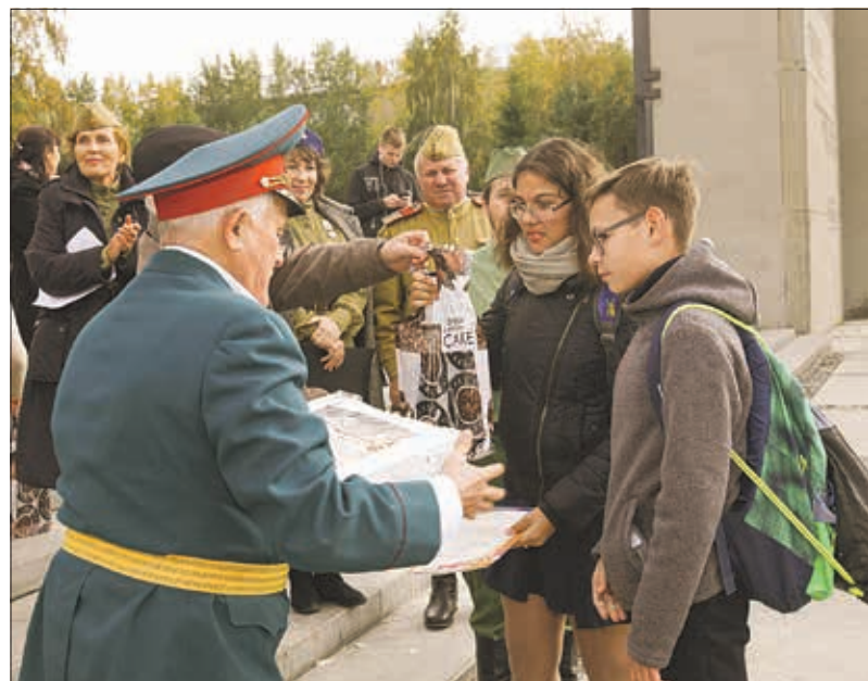
Квест-игру «Эстафета патриотизма поколений» проводили ветераны Великой Отечественной войны.

Пока число серебряных волонтеров в регионе не превышает и ста человек. В основном это жители Новосибирска — участники проекта «Городской доброхот». В областном центре практика привлечения ветеранов к добровольческой деятельности начала реализовываться еще с 2016 года. Добровольцы «55+» будут работать по нескольким направлениям: социальное, экологическое, спортивное, событийное волонтерство, выступать наставниками для молодежи, проводить профориентационные мероприятия.