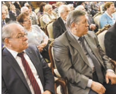
Встреча в дни декады пожилых людей.

— Ветераны — самая активная часть населения. Они являются участниками всех важнейших мероприятий в масштабах государства, в жизни города, районных центров, сел. Именно поэтому при посещении муниципальных районов я в обязательном порядке встречаюсь с сове-