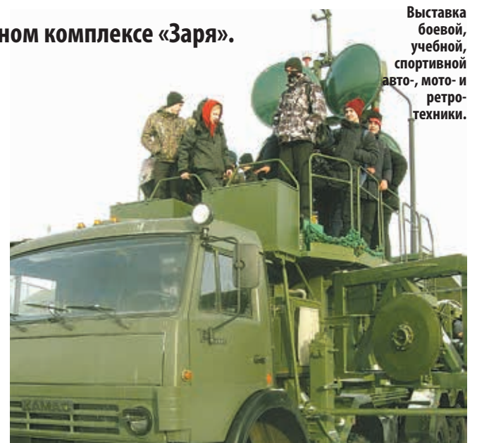
Выставка боевой, учебной, спортивной авто-, мото- и ретро-техники.

— Я впервые участвовал в Дне призывника. Мы играли в мини-футбол. У нас не было никаких тренировок накануне, получалось так, что мы как в боевой обстановке должны были сразу стать командой. Спорт в моде у молодых, но мы не умеем организоваться. Было бы здорово, если бы ветераны смогли организовать молодежь на спорт прямо во дворах.