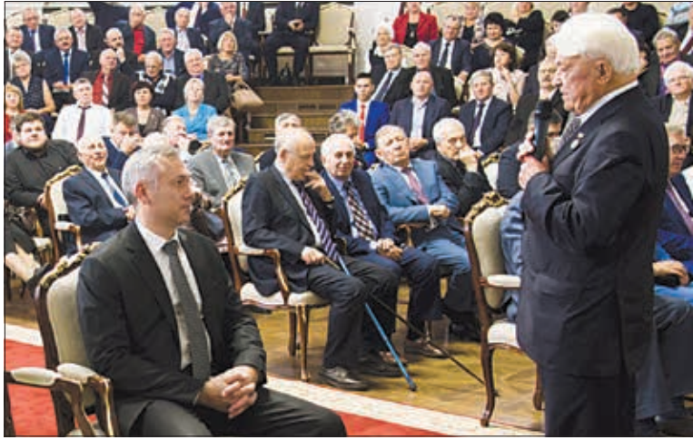
В этом году Ассоциации землячеств Новосибирской области исполнилось 15 лет.