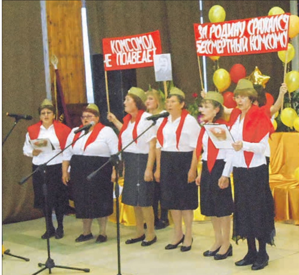
В XV районном фестивале, финал которого состоялся 10 октября 2018 года, приняли участие 13 клубов общения пожилых людей Колыванского района.

Стало традицией вести переписку с ребятами, ушедшими в армию и их командирами. О том, как служится молодым солдатам, ветераны рассказывают потом на встречах со школьниками, публикуют благодарственные письма командиров в районной газете.