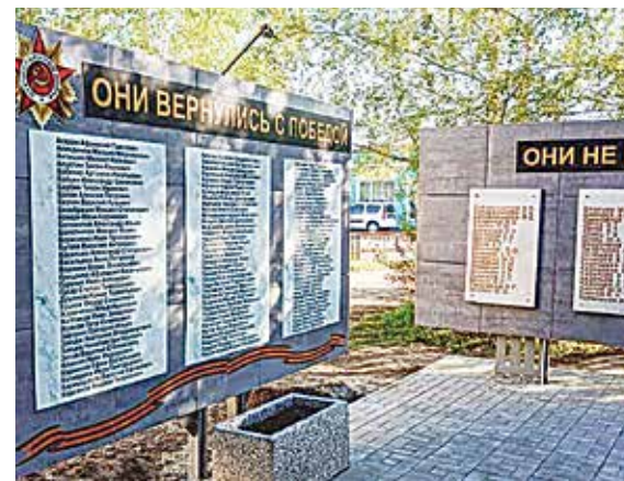
В Майском состоялось открытие мемориальной доски с именами героев вернувшихся с победой. Это стало возможным благодаря выигранному гранту в рамках проекта «Сохранение, использование и охрана объектов культурного наследия».