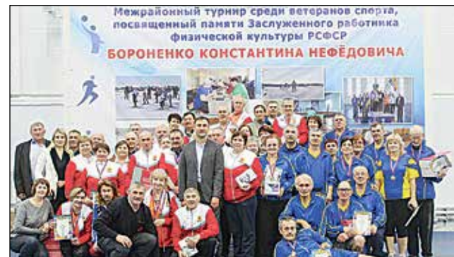
Призеры турнира после церемонии награждения.