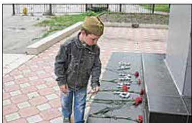
«Свеча памяти-19» в Коченево.

Сколько свечей в ходе акции зажжено на сайте, столько средств будет выделено на поддержку ветеранов Великой Отечественной войны: 1 виртуальная свеча — это 1 рубль. Все средства будут направлены Благотворительным фондом