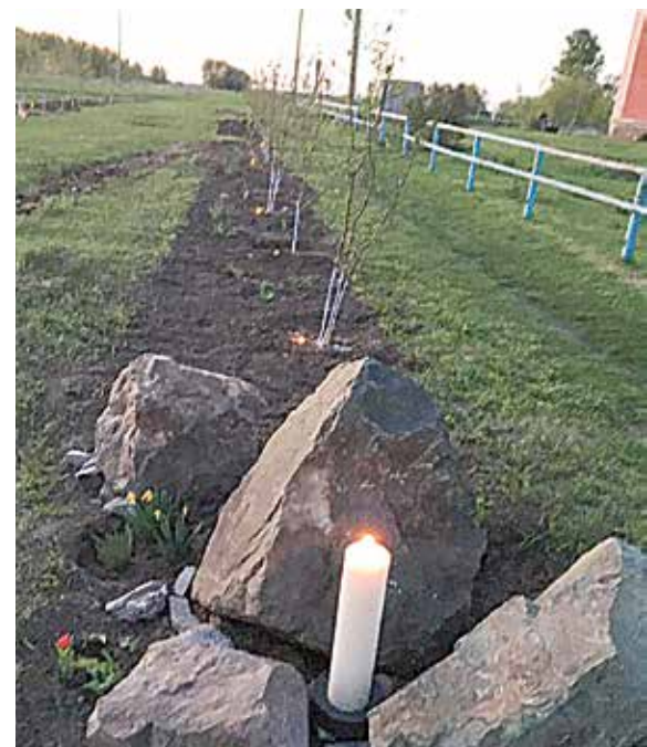
Во всех населенных пунктах района заложены аллеи героев, посажены деревья.

Свеча — символ духовного света веры, милосердия, памяти. Школьники и студенты, пенсионеры и члены общественных организаций, а также случайные прохожие оставляют десятки горящих свечей у мемориала Славы на привокзальной площади имени Кабакова, озаряя пилоны с именами погибших скорбным светом памяти.