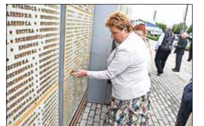
У чумлыцкого мемориального комплекса.

22 июня по всей стране проводятся памятные мероприятия, различные патриотические акции, приспускаются государственные флаги,