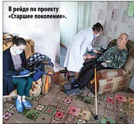
В рейде по проекту «Старшее поколение».