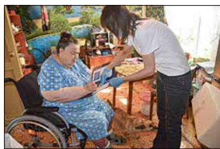
В строке «получено» ветераны ставили свою подпись.