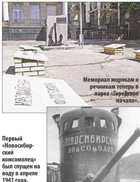
Первый «Новосибирский комсомолец» был спущен на воду в апреле 1941 года.

На её боевой рубке золотом поблёскивают слова: «Новосибирский комсомолец». Такие лодки звали малютками официально, за небольшие размеры. Она стала первой из четырёх, носивших название нашего города. Одна из них — как музей — стоит на Химкинском водохранилище.