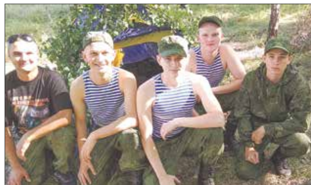
Барабинские юнармейцы готовятся служить в ВДВ.

В Новосибирской области более 19,5 тысяч пожилых граждан и инвалидов получают социальные услуги на дому, 8 508 пожилым гражданам и инвалидам предоставлены социальные услуги специалистами мобильных бригад. Количество граждан, охваченных социальными сервисами (школы ухода, пункты проката и др.) — 22 667 человек. Количество сиделок, прошедших обучение — 441.