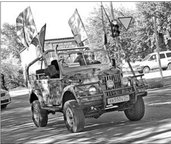
По улицам Каргата.