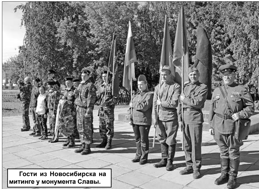
Гости из Новосибирска на митинге у монумента Славы.