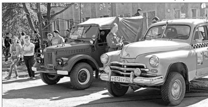
«Сквозь огонь и воду мы прошли...»

В Каргат на часок «забежали» военные ретро-автомобили. Это мероприятие называлось красиво и высокопарно. Наберитесь духа и прочитайте до конца: «Пробег военных ретро-автомобилей «Марш Победы», посвящённый столетию первого Трижды Героя Советского Союза Александра Покрышкина, шестьдесят восьмой годовщине Победы советского народа в Великой Отечественной войне и семидесятипятилетию присвоения сто пятидесятой Сибирской добровольческой дивизии имени И. В. Сталина звания 22-ой гвардейской». Многозначность посвящения обещала торжественность момента. И оно по замыслу организаторов должно было компактно уместиться в час.