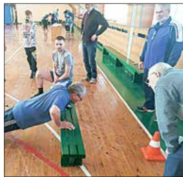
Клуб здоровья для ветеранов

Каждый пленум районного совета ветеранов — важное событие в районе, в его работе всегда принимают участие глава района, ее заместители, глава города, специалисты, депутаты Законодательного собрания и районного совета депутатов. Поэтому решения принимаются не декларативные, а реально выполнимые для ветеранской организации района. По итогам каждого пленума или заседания президиума совета