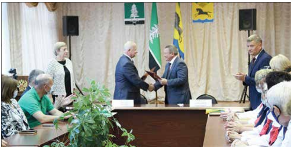
Подписание Соглашения о побратимстве городов Нелидово Тверской области и Карасука Новосибирской области. В рамках проекта «Дорогой памяти и славы» экспедиция Карасукского района побывала в Тверской области на местах захоронений земляков в годы Великой Отечественной войны (1941 — 1945 гг.). Этот проект, подготовленный поисково-патриотическим клубом «Отечество», был удостоен президентского гранта.

После войны Герой вернулся в родной район, работал на ответственных должностях райкома партии. В 1974 году был похоронен с почестями в городе Карасук.