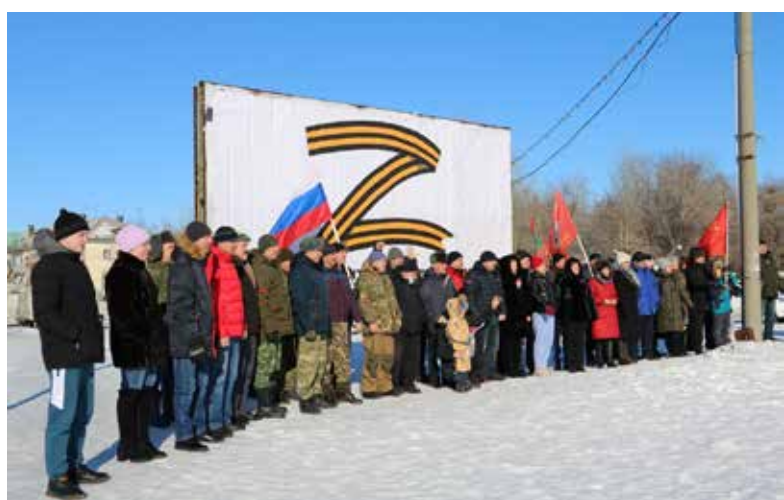
Участники автопробега Барабинск-Куйбышев.