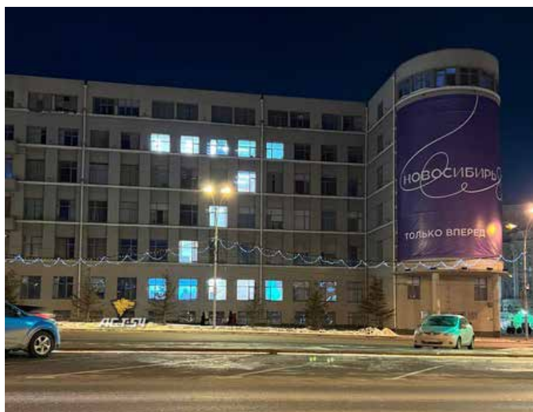
В зданиях правительства Новосибирской области и Законодательного собрания региона по вечерам оставляют зажженным свет в окнах в форме буквы Z.