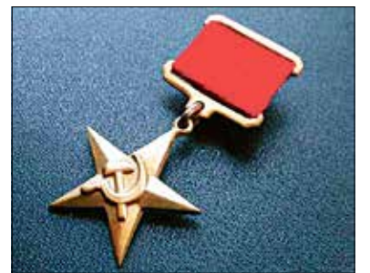
22 мая 1940 года вышел Указ Президиума Верховного Совета СССР об учреждении золотой медали «Серп и Молот» — знака отличия Героя Социалистического Труда.

На месте трагедии, на 64 километре трассы Новосибирск-Ордынское стоит монумент памяти сотрудникам ГАИ —