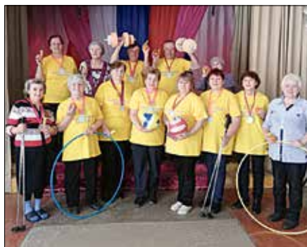
В желтых майках лидеров в Новорешетовском — только победа!

На срочную службу тут пойдут хорошо подготовленные ребята. Они будут служить в сухопутных, воздушно-космических, воздушно-десантных войсках, ракетных войсках стратегического назначения, войсках национальной гвардии и в Военно-Морском флоте.