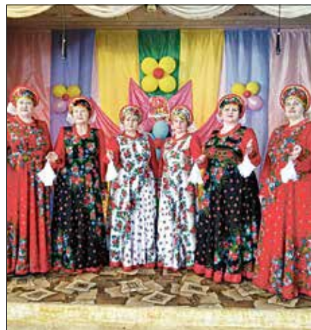
Прекрасный вокальный ансамбль «Рябинушка» Новорешетовского ДК «Ровесник» — приносит плоды радости круглый год.

И менно так «солнечной стороной» стараются повернуть жизнь для пожилых людей в Кочковском районе. Первая забота — здоровье, и каждая первичная организация создает клубы, секции, кружки. «На солнечной стороне жизни» — это акция к Дню пожилых людей в Новосибирске.