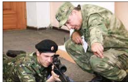
Стартом Дня призывника послужило открытие клуба огневой подготовки.