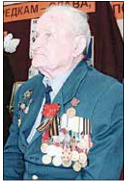
На празднике 9 Мая 2008 года.

Постоянно вел большую работу по военно-патриотическому воспитанию молодежи.